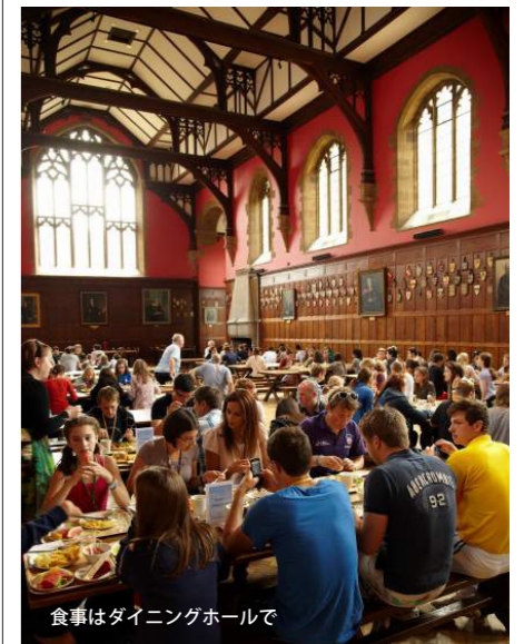
食事はダイニングホールで