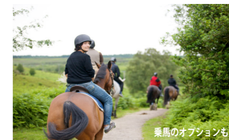
乗馬のオプションも

乗馬に興味があれば、アクティビティの一部として週 6 時間、地元の厩舎にて乗馬やグルーミングのレッスンを受けることも可能です。乗馬の日程は、週によって異なります。