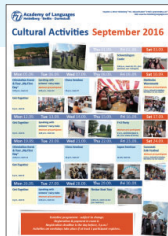
▲アクティビティ予定表