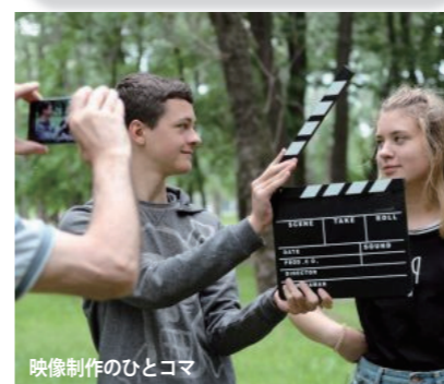
映像制作のひとコマ