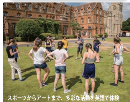
スポーツからアートまで、多彩な活動を英語で体験