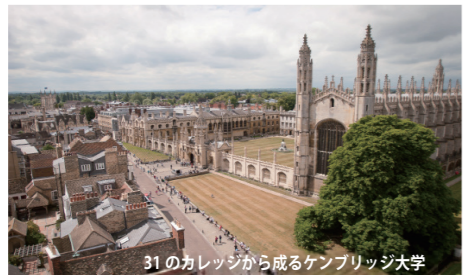
31 のカレッジから成るケンブリッジ大学

研修を運営するのはケンブリッジ市内で 72 年に渡り英語教育を実施している Studio Cambridge。British Council の認可を受け、年間を通じたプログラムの他に、夏季にケンブリッジ大学の施設を利用したティーンエイジャー向けのプログラムを数多く運営しており、実績を積んだ老舗の学校です。