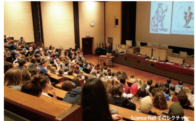
Science Hall でのレクチャー

ケンブリッジはケム川の畔に広がる静かな大学町。プログラムは、ケンブリッジ大学ニューナムカレッジと隣接する大学付属の神学カレッジ、リドリーホールにて行われます。地元の英語学校 Studio Cambridge が毎年運営し今年で59年目を迎える人気のサマーコースです。対象年齢は14~17歳の中・高校生、ケンブリッジ大学の施設に滞在しながら、英語と大学町を堪能し、フリータイムも楽しめます。