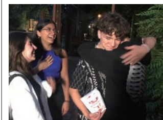
▲最終日のフェアウェル。「また会おう!」