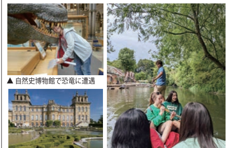
▲自然史博物館で恐竜に遭遇