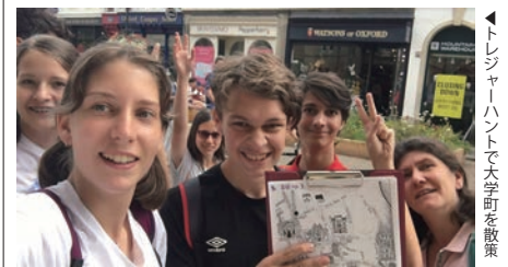
▶トレジャーハントで大学町を散策

アクティビティの後、ホームステイ先へ帰宅するまでの夕方の時間はフリータイム。大学町の魅力を満喫できます。